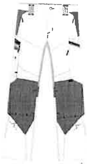
PULSE ACTION Bundhose

erklärt der Hersteller in alleiniger Verantwortung, dass die nachfolgend abgebildeten Artikel