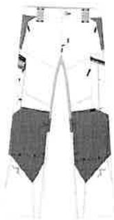
PULSE POWER Bundhose