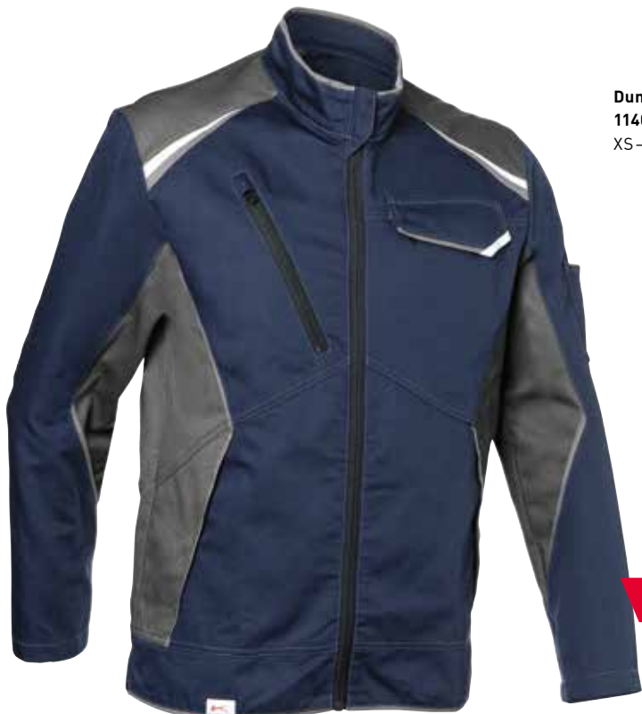
Dunkelblau | Anthrazit 1140 5336-4897 XS-4XL