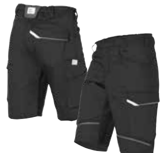
Schwarz | Anthrazit 2440 5336-9997 40-66

AUCH IN WEISS | ANTHRAZIT VERFÜGBAR: SEITE 29