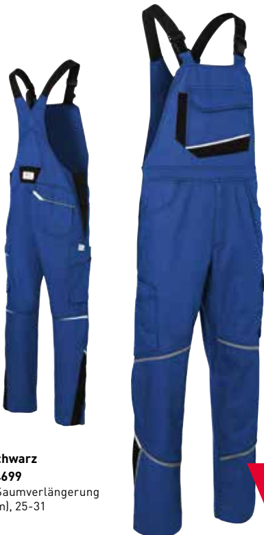
Kbl.blau | Schwarz 3140 5336-4699 40-66 (inkl. Saumverlängerung um bis zu 5 cm), 25-31