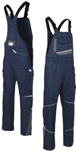
Dunkelblau | Anthrazit 3140 5336-4897 40-66 (inkl. Saumverlängerung um bis zu 5 cm), 25-31