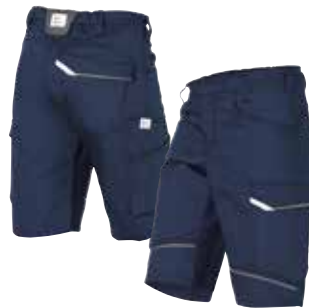
Dunkelblau | Anthrazit 2440 5336-4897 40-66