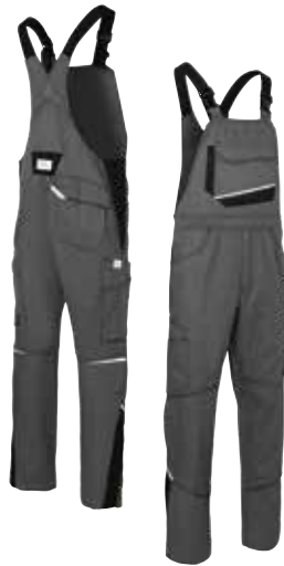
Anthrazit | Schwarz 3140 5336-9799 40-66 (inkl. Saumverlängerung um bis zu 5 cm), 25-31