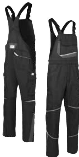
Schwarz | Anthrazit 3140 5336-9997 40-66 (inkl. Saumverlängerung um bis zu 5 cm), 25-31