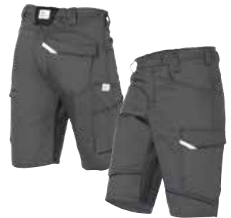
Anthrazit | Schwarz 2440 5336-9799 40-66