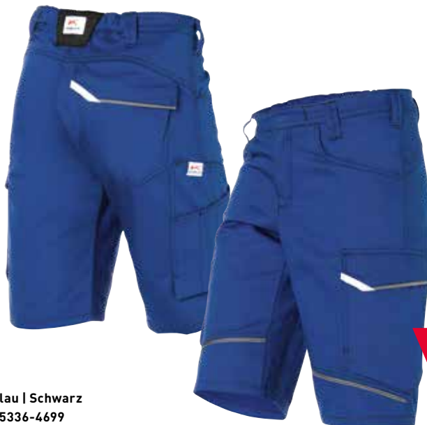
Kbl.blau | Schwarz 2440 5336-4699 40-66